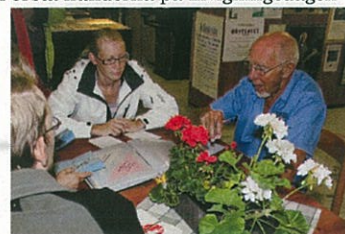
Beställning av julens servettryck