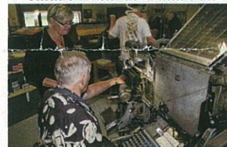
Första kunderna på invigningsdagen