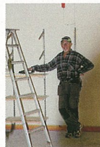
Invigningen 28 juli 2010